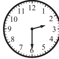
Son las dos y media.